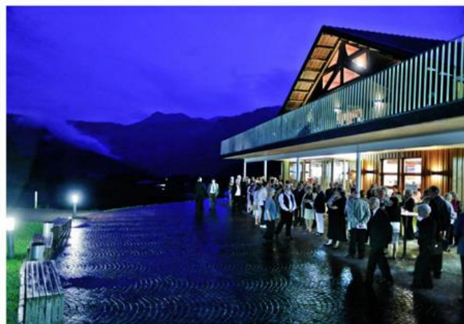
Konsertsalen i Schwarzenberg, Angelika Kauffmann Saal, ligger vakkert til. I pausen nyter publikum utsikten.