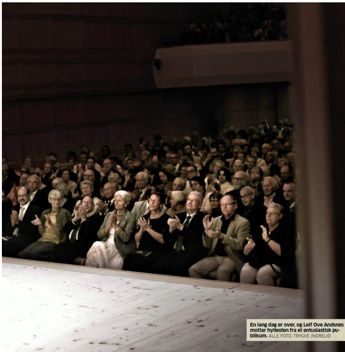
En lang dag er over, og Leif Ove Andsnes mottar hyllesten fra et entusiastisk publikum.