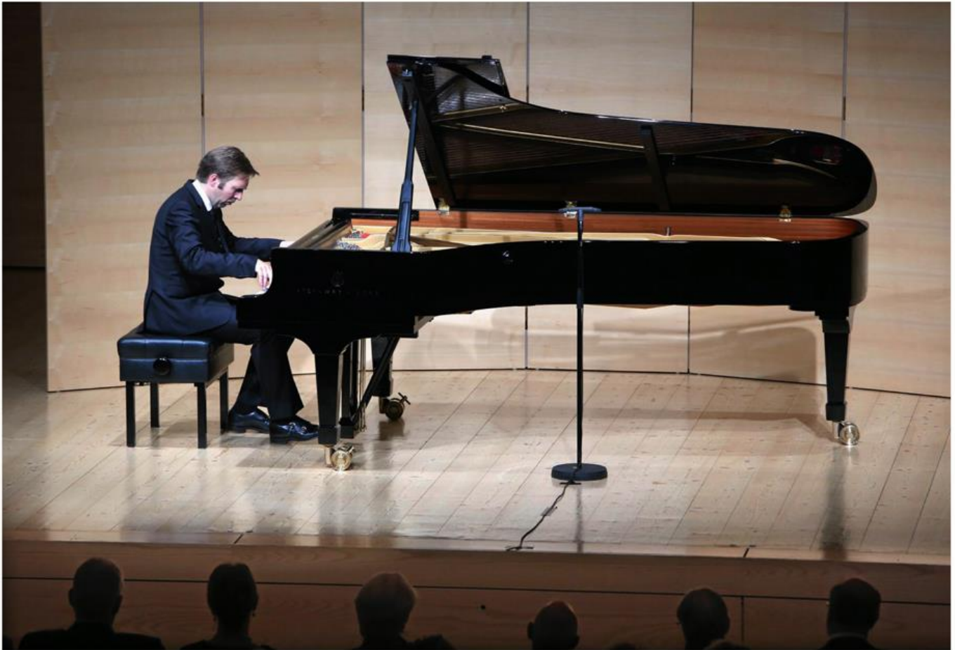
Minimalistisk stil - en mann og et flygel. Men når Leif Ove Andsnes slår an tonen, fylles rommet av store kontraster.